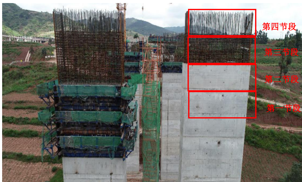
图 2 左幅 4 号墩模板作业

EK0+880 桥左幅 4 号墩柱模板工班组开始进入现场施工，班组长龙珍奇带领作业人员杨国志、王祥、赵满芽登上已施工至 31.1 米的墩柱模板作业平台上进行模板安装和拆除工作。首先在原有的一、二、三节段模板上方安装了第四节段模板（见图 2），随后吊拆第一节横桥向左右侧两块模板，11 时 30 分许开始吊拆大里程侧第一节纵向模板，施工人员取掉该模板的手动葫芦，当该模板还未起吊离开墩身时，其他模板整体突然向下滑落，墩身上全部钢模板及 4 名作业人员随模板一起坠落至地面。其中龙珍奇、杨国志、王祥坠落在墩柱大里程纵向侧，3 人均死亡；赵满芽坠落在墩柱小里程纵向侧，重伤。